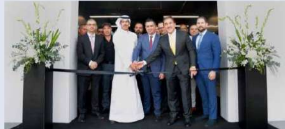
جانب من حفل افتتاح المركز الجديد... «شمال الخليج» تفتتح مركزاً جديداً لخدمة العملاء...