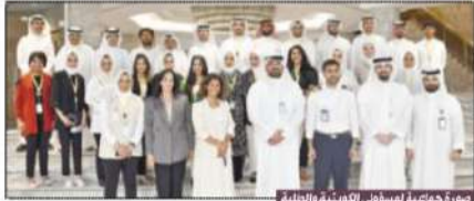
صورة جماعية لمسؤولي الكويتية والطلبة