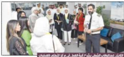
التمثيل خلال اللقاء... شرح آلية العمل في مركز التحكم بالعمليات