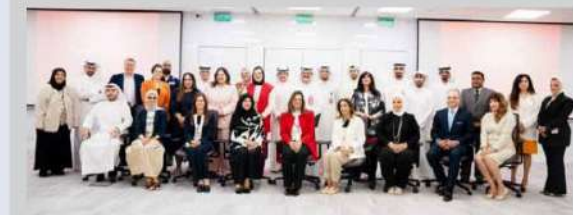
لقطة جماعية مع الخريجين... «الخليج» يخرج أول دفعة من قادة المستقبل...