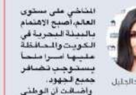
دول الفاضل... «الوطني» يطلق حملة للتوعية بحماية البيئة البحرية...