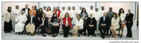
فريق البادل والفرق مع المرشحين

أعلن بنك الخليج تخرج أول دفعة من قادة المستقبل ضمن برنامج «Beyond AJYAL» للمديرين والقياديين، الذي انطلق في الكويت عام 2019 بهدف تطوير مهارات القياديين الشباب في القطاع المصرفي. ويهدف البرنامج إلى إعداد قادة المستقبل من خلال توفير فرص تدريبية وتعليمية، وذلك من خلال تقديم دورات تدريبية في مجالات مختلفة. ويذكر أن «الخليج» تسعى دائماً إلى تطوير برامجها لتتناسب مع احتياجات سوق العمل، وذلك من خلال التعاون مع الجهات المعنية.