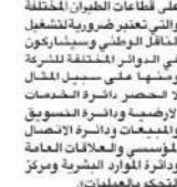
مؤسسة جامعة الكويت، «الكويتية»

بشراكة مع «إنجاز» بدأت «الكويتية» برنامجاً لتدريب طلبة الجامعات والخريجين بالتعاون مع «إنجاز» بهدف تطوير مهارات الخريجين والطلبة في سوق العمل. ويهدف البرنامج إلى تزويد الخريجين والطلبة بالمهارات اللازمة لسوق العمل، وذلك من خلال تقديم دورات تدريبية في مجالات مختلفة. ويذكر أن «الكويتية» تسعى دائماً إلى تطوير برامجها لتتناسب مع احتياجات سوق العمل، وذلك من خلال التعاون مع الجهات المعنية.