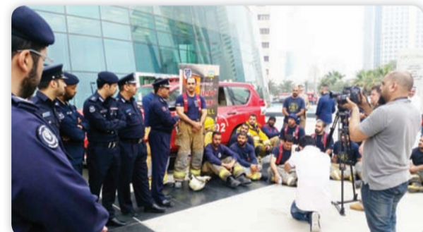
كتب عبدالله المفرح:

الهدف هو التأمين والوقوف على الجاهزية والاستعداد للتعامل مع الأبراج