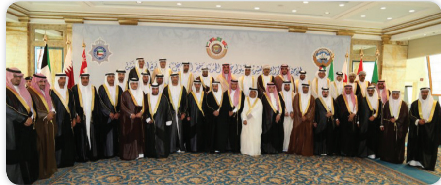
● صورة جماعية للمشاركين