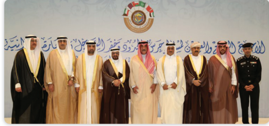
● اللواء محمد اليوسف والمشاركين في الاجتماع